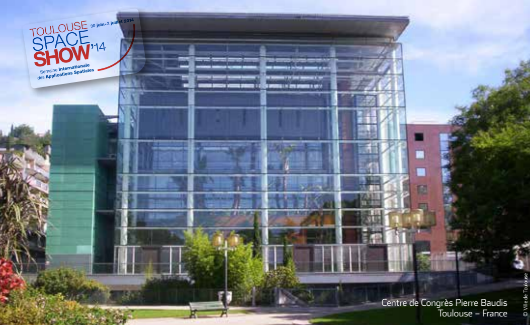
Centre de Congrès Pierre Baudis Toulouse - France